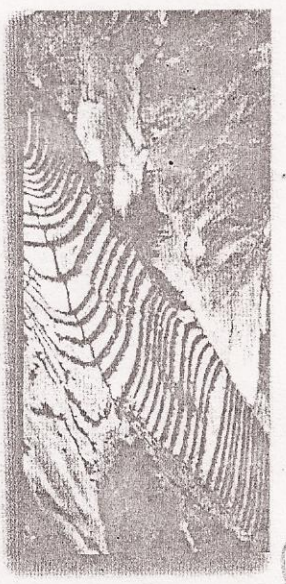
Sistema de cultivo de terrazas utilizado por los incas.

La sociedad estaba integrada por los parientes del Inca que formaban la aristocracia . El curaca se encontraba al frente de cada ayllus , que era la unidad económico-social y religiosa del pueblo inca. Su economía era eminentemente agrícola y estaba muy desarrollada a pesar de las dificultades que presentaba el terreno montañoso. Se utilizaba