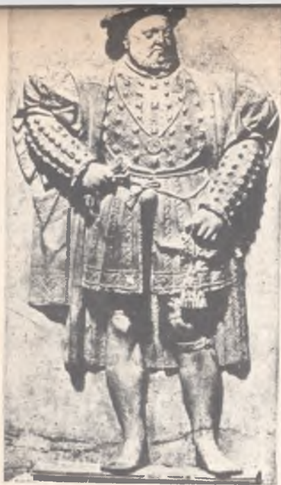
El rey Enrique VIII de Inglaterra. El relieve en piedra —de autor ignorado— reproduce con exactitud el rostro sensual y el cuerpo obeso del monarca.