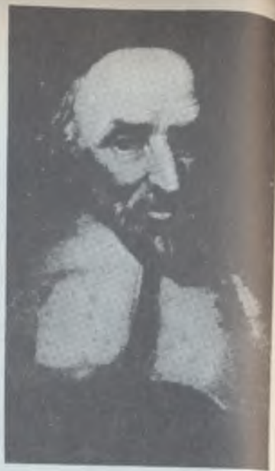
El rostro de Juan Knox, según un grabado antiguo. Discípulo de Calvino; este reformador dirigió en Escocia la lucha contra el catolicismo.