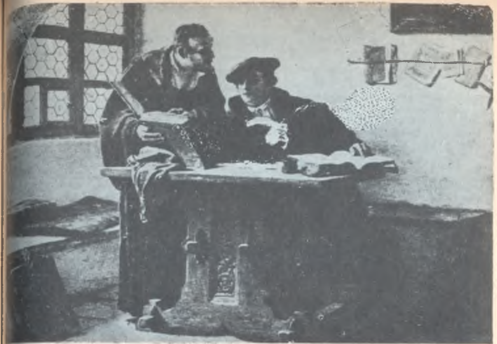
En su gabinete de trabajo, Martín Lutero —acompañado por su discípulo Felipe Melancthon— traduce la Biblia al alemán moderno.

En 1527, la Dieta de Westeras aprobó la doctrina protestante, con algunas variantes que la hicieron más atenuada.