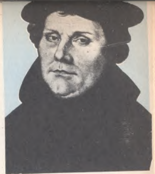
El reformador religioso Martín Lutero, según un retrato pintado por Lucas Cranach, en el año 1520. Observe la firmeza de carácter que expresa el rostro del personaje.

De acuerdo con ello no importan los pecados, pues sólo la fe en Cristo y en sus méritos es suficiente para conseguir la salvación eterna. De tal manera, los hechos y las obras del cristiano carecen en absoluto de valor. Así surgió lo que hoy podemos llamar la "teología luterana" que hasta ese momento (año 1515) no había tenido trascendencia porque Lutero se mantenía obediente a la Iglesia Católica y a la autoridad pontificia.