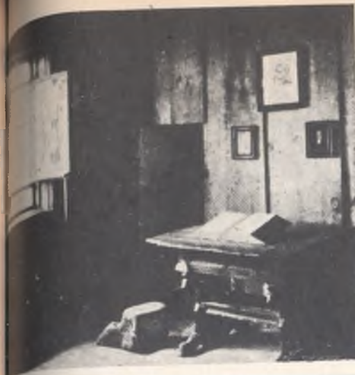
El cuarto de estudio que utilizó Lutero en el castillo de Wartburgo, donde tradujo la Biblia alemán moderno.

Temeroso de la justicia divina, Lutero llegó a la conclusión de que la voluntad humana era insuficiente para conseguir la salvación. Al fin una frase de San Pablo —"el justo vivirá por la fe"— le permitió conseguir la paz espiritual.