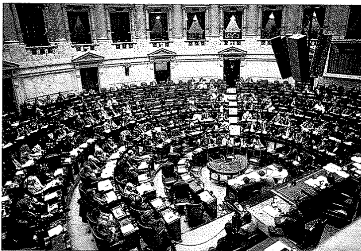
Sesión de la Cámara de Diputados.

Constitución de la Nación Argentina. Capítulo quinto.