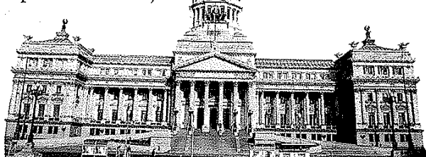
El edificio del Congreso Nacional está ubicado sobre la avenida Entre Ríos, entre Hipólito Yrigoyen y Rivadavia, en la Ciudad de Buenos Aires.

El proceso de desprestigio de la política envolvió a las instituciones representativas y de debate, como el Congreso. Algunos estudios de opinión señalan que ciertos sectores de la ciudadanía consideran que la labor parlamentaria es lenta, ineficaz y costosa; incluso llegan a cuestionar el papel efectivo del Congreso en el funcionamiento de la democracia. Sin embargo, en la práctica, frente a crisis institucionales como la de 2001, el Congreso demostró su papel fundamental para conservar los canales institucionales de la democracia. En aquella oportunidad, frente a la renuncia del presidente De la Rúa (y la ausencia de vicepresidente), la Asamblea Legislativa designó un presidente provisional (Eduardo Duhalde) hasta la estabilización y la convocatoria a elecciones. En otra ocasión, hacia mediados de 2008, el Congreso participó activamente para destrabar el conflicto entre el Poder Ejecutivo y sectores de la sociedad que rechazaban una modificación a los aranceles que pagan las exportaciones de soja.